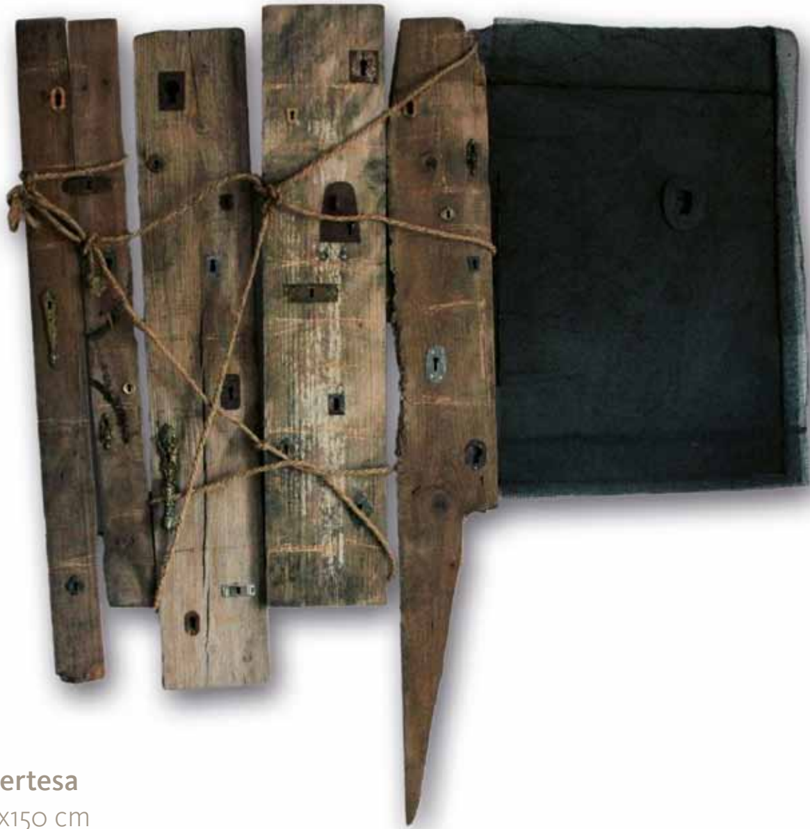
Incertesa 156x150 cm Ensamlatge