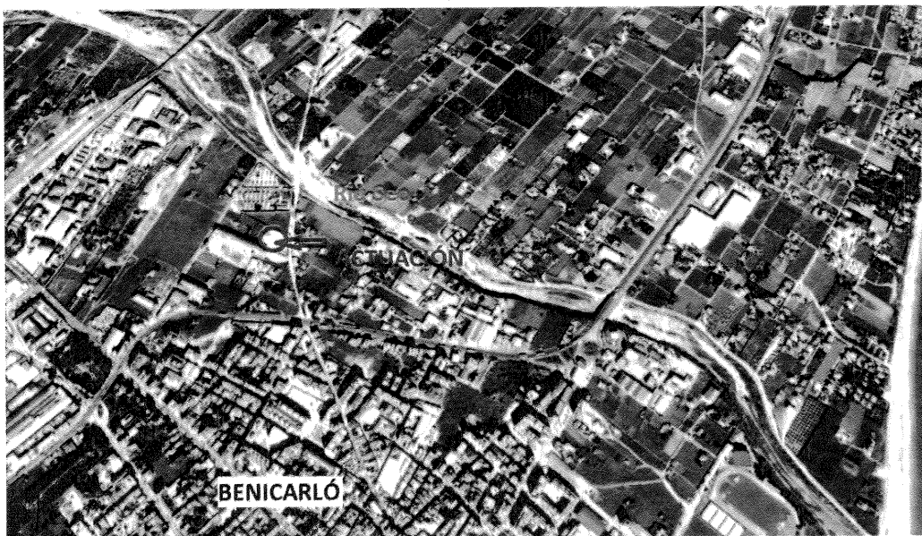
Ubicación de la actuación