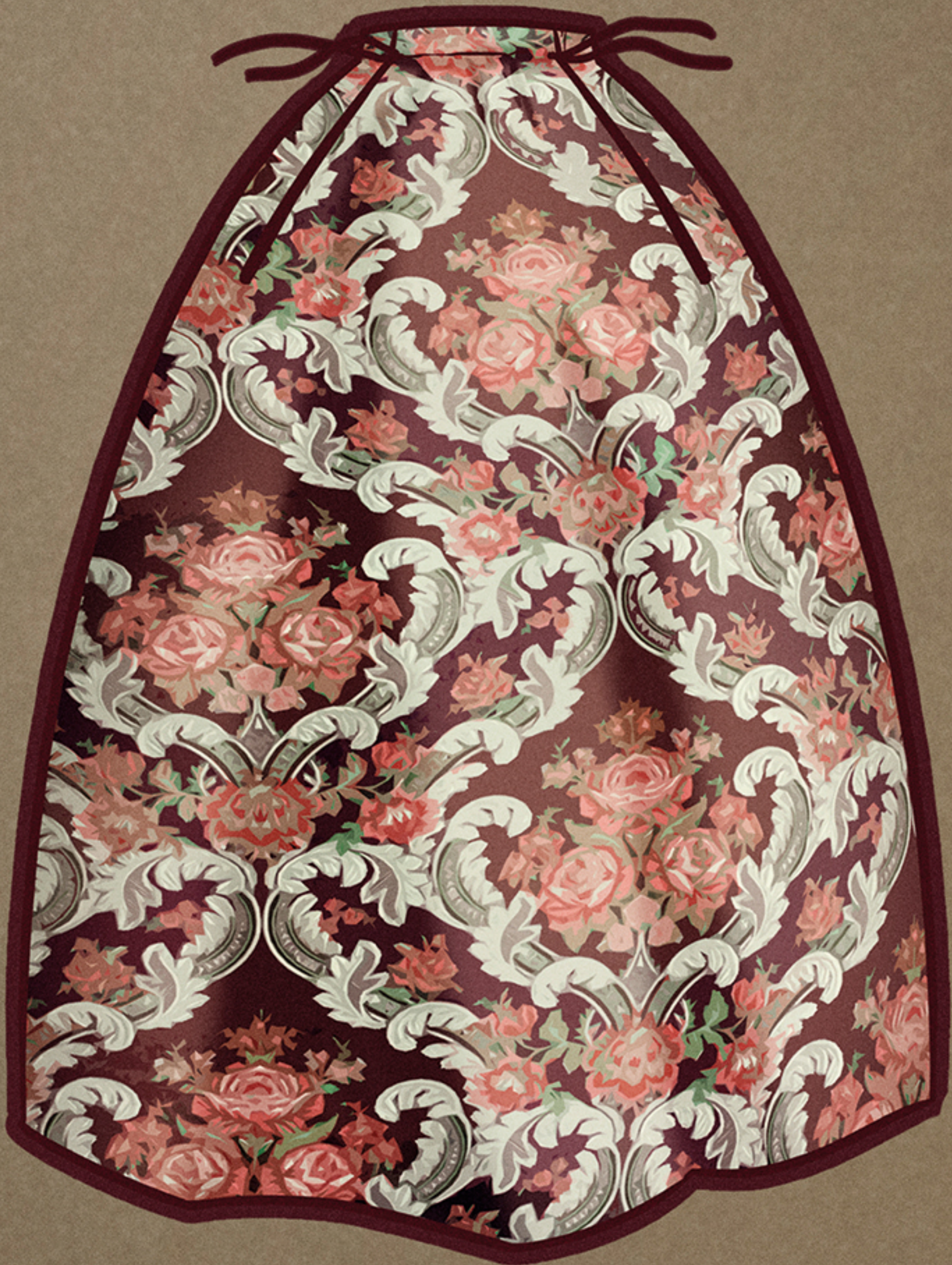
Guardapeu o falda