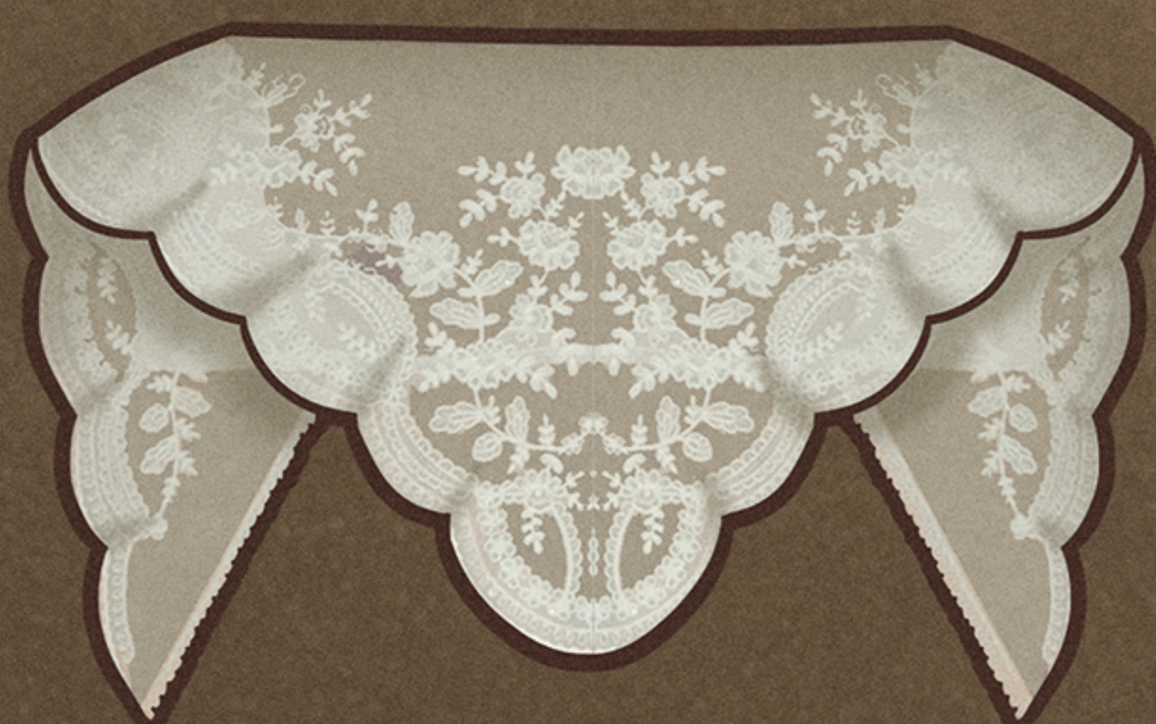
Mocador de pit