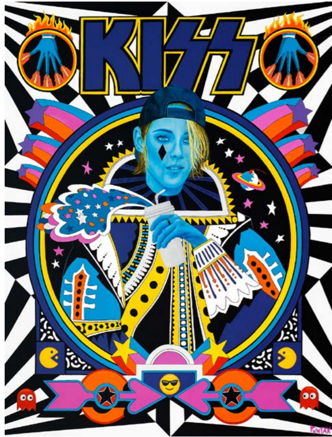
Kristen & Kiss. 2022. Acrílico sobre lienzo (146x114)