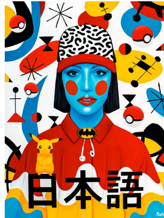
Free Britney. 2021. Acrílico sobre lienzo (146x114)