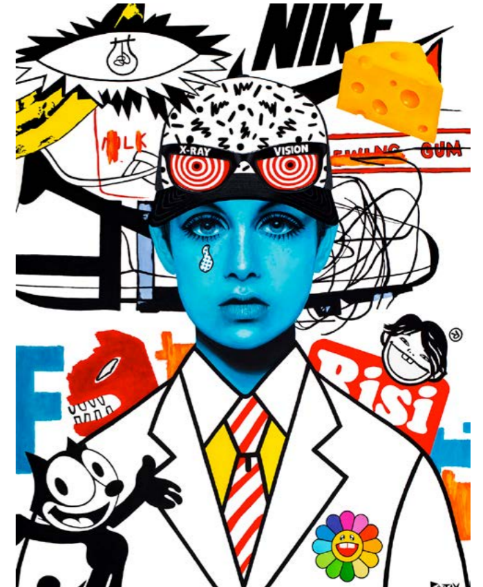
Risi. 2021. Acrílico sobre lienzo (146x114)