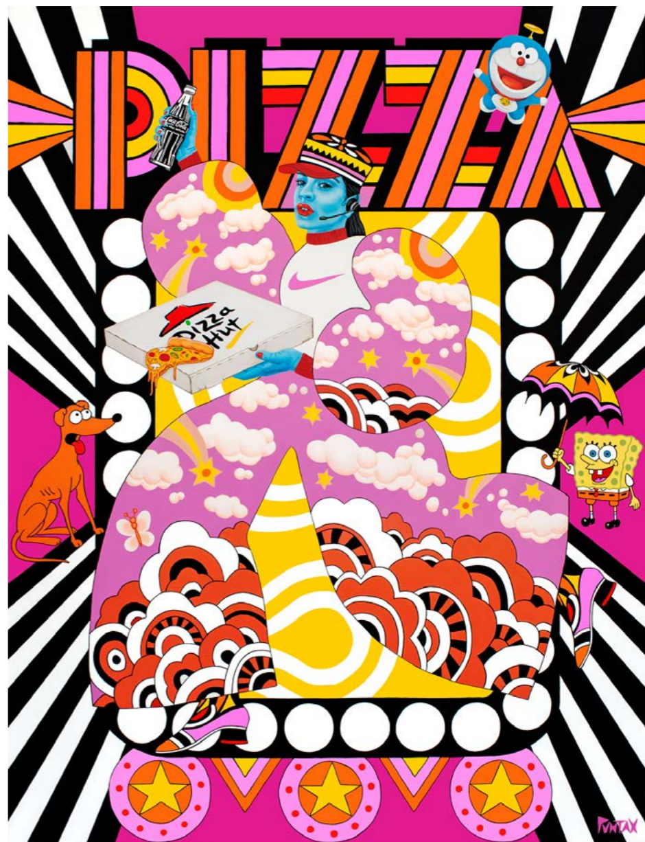
Pizza tra tra. 2022. Acrílico sobre lienzo (146x114)