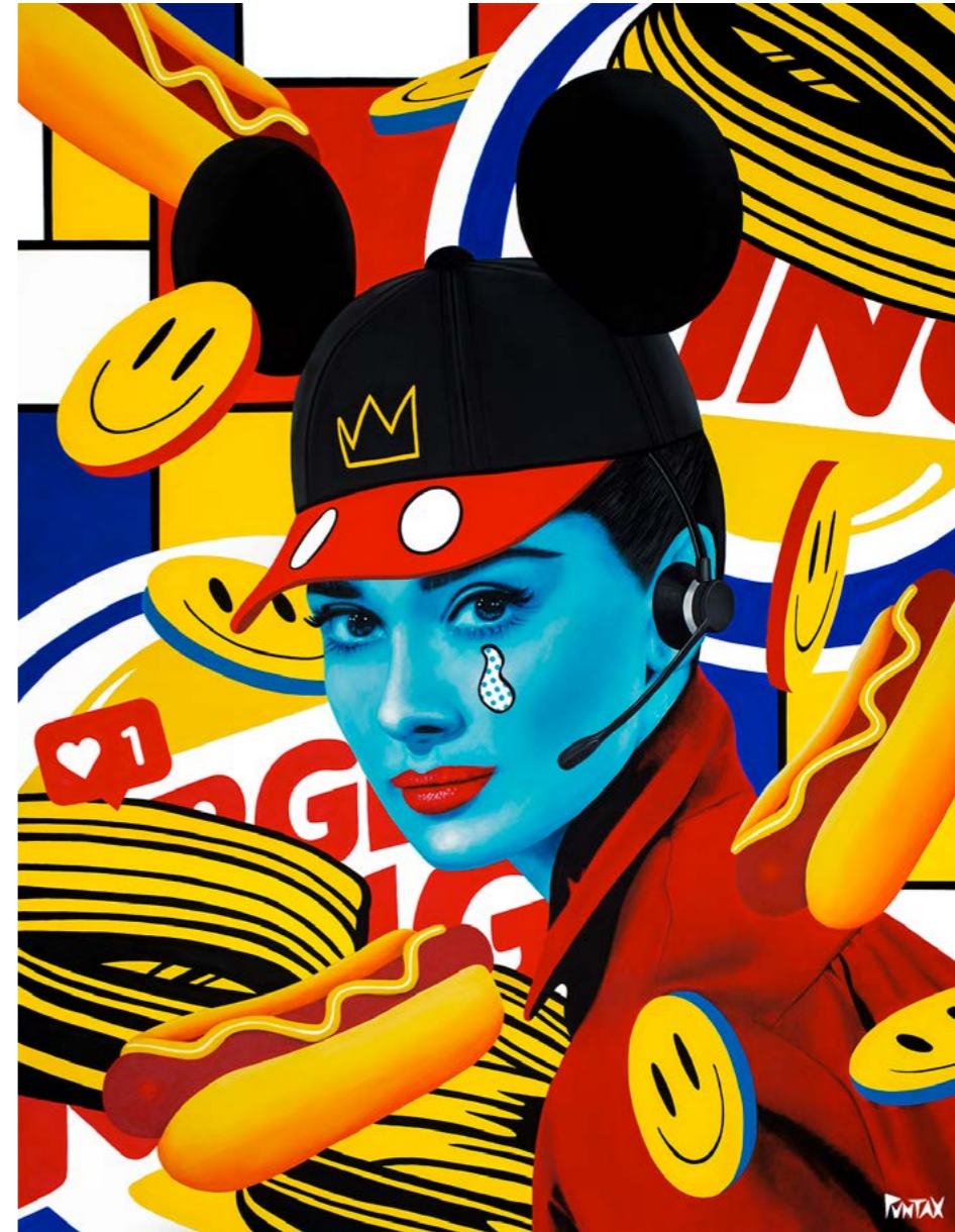
Fast food. 2021. Acrílico sobre lienzo (146x114)