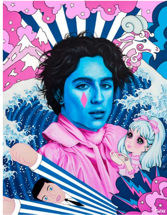
Capricorn fantasy. 2022. Acrílico sobre lienzo (146x114)