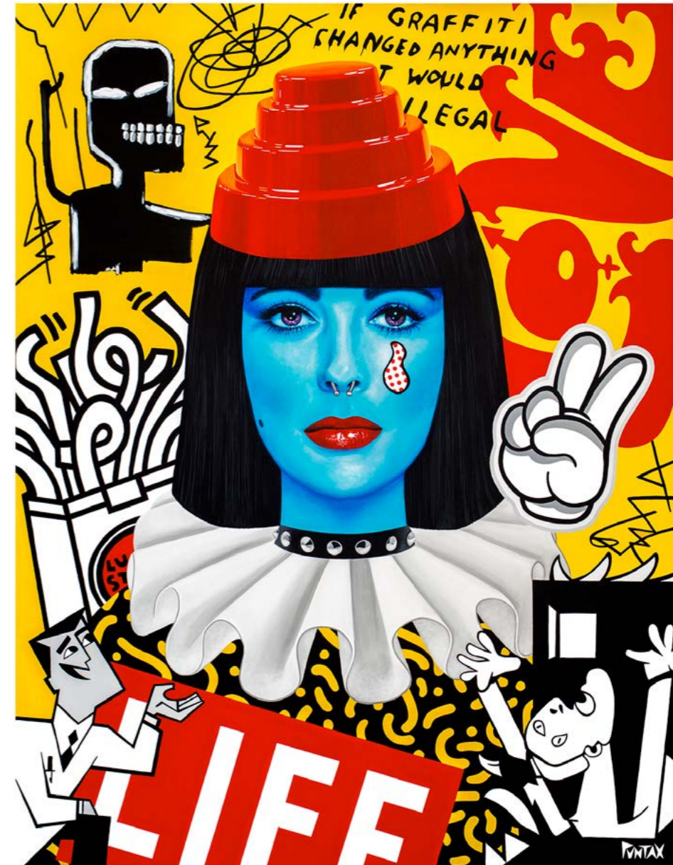
Liz Life. 2021. Acrílico sobre lienzo (146x114)