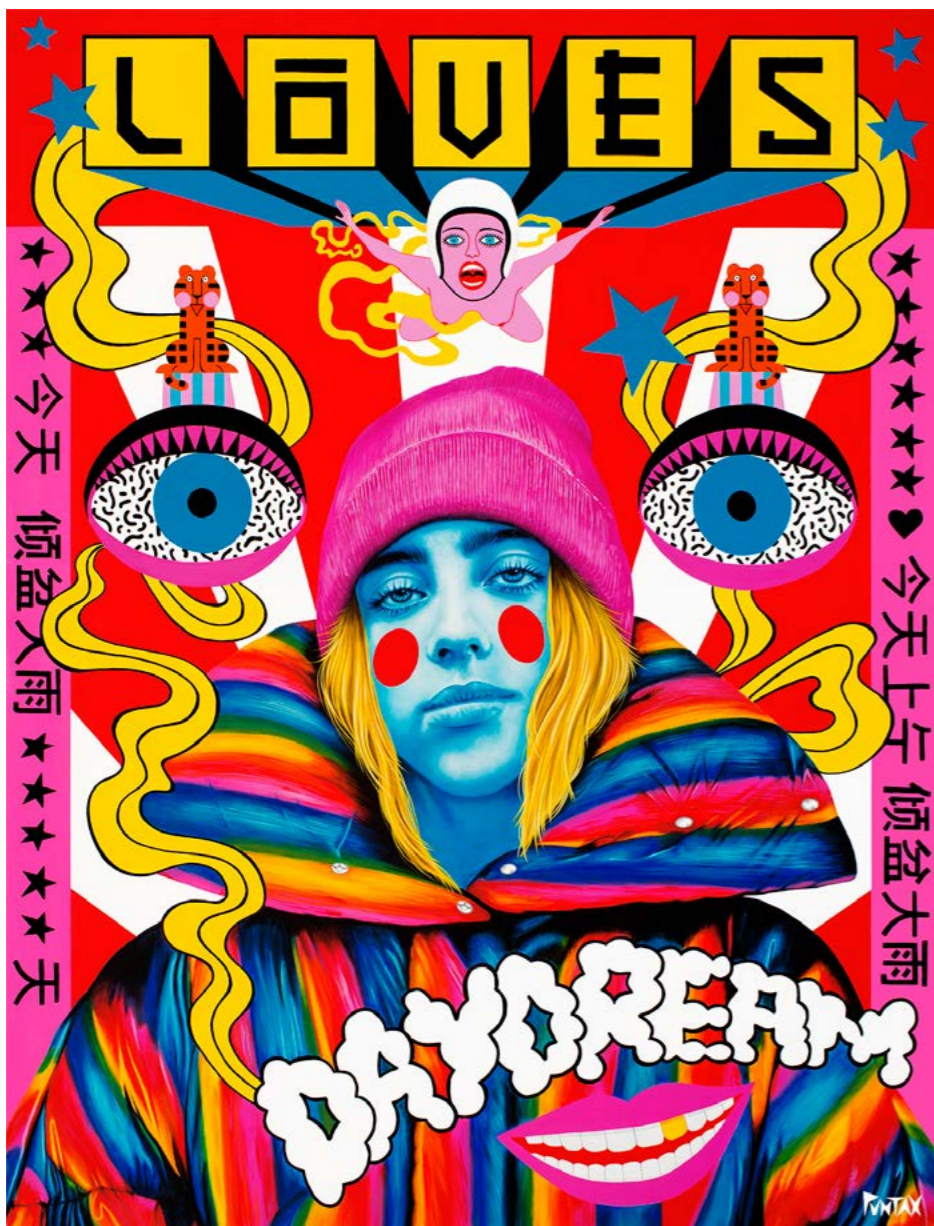
Supercolors loves. 2022. Acrílico sobre lienzo (146x114)