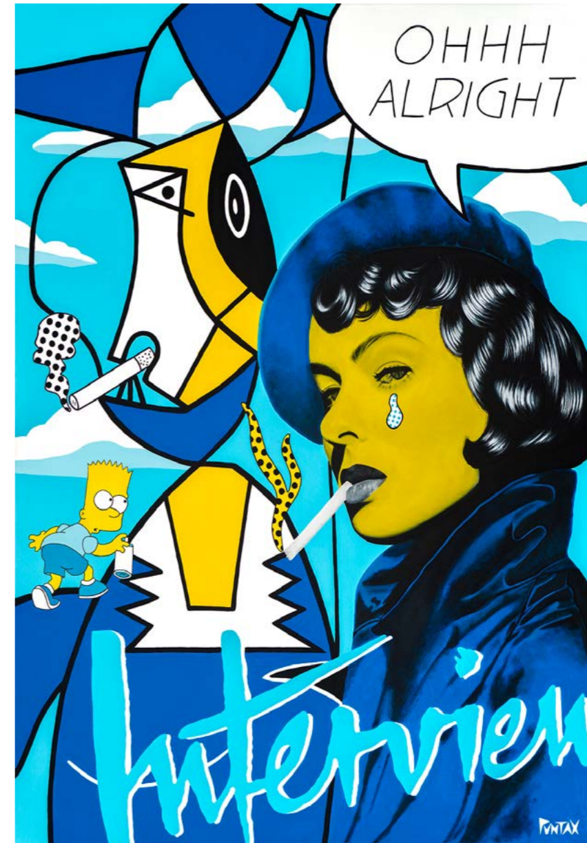
Etapazul. 2021. Acrílico sobre lienzo (100x73)