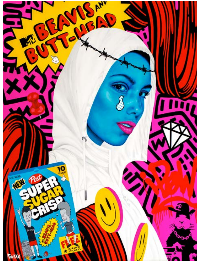
Supersugar crisp. 2021. Acrílico sobre lienzo (146x114)