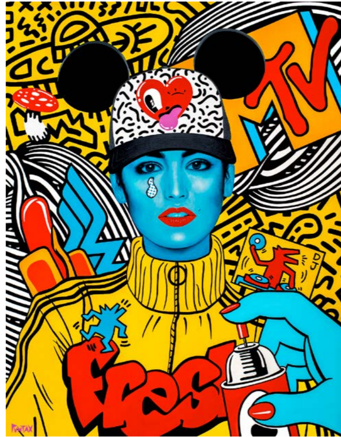
Cindy Fresh. 2021. Acrílico sobre lienzo (146x114)