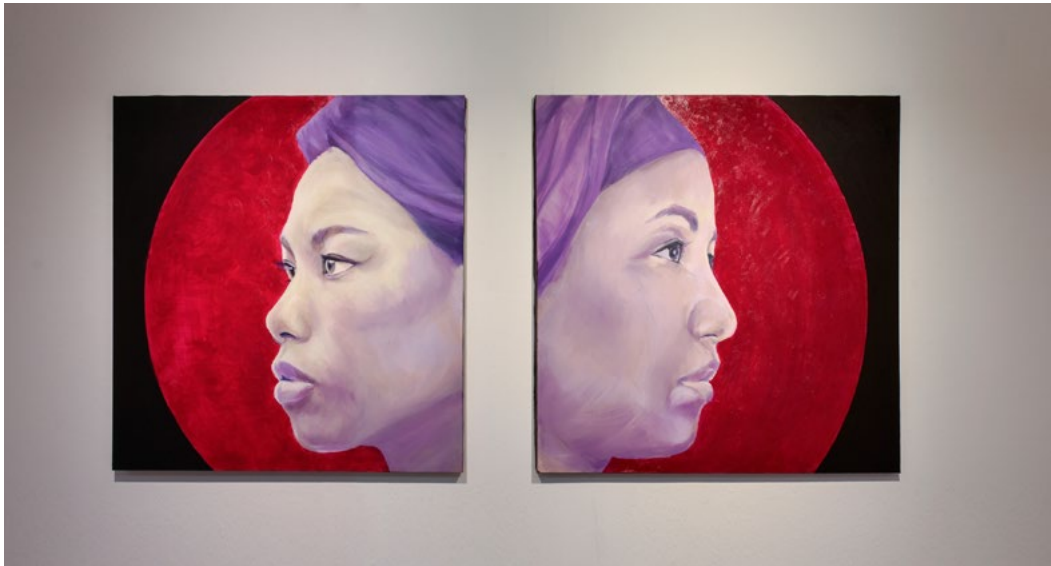
Inteligencia y sabiduría