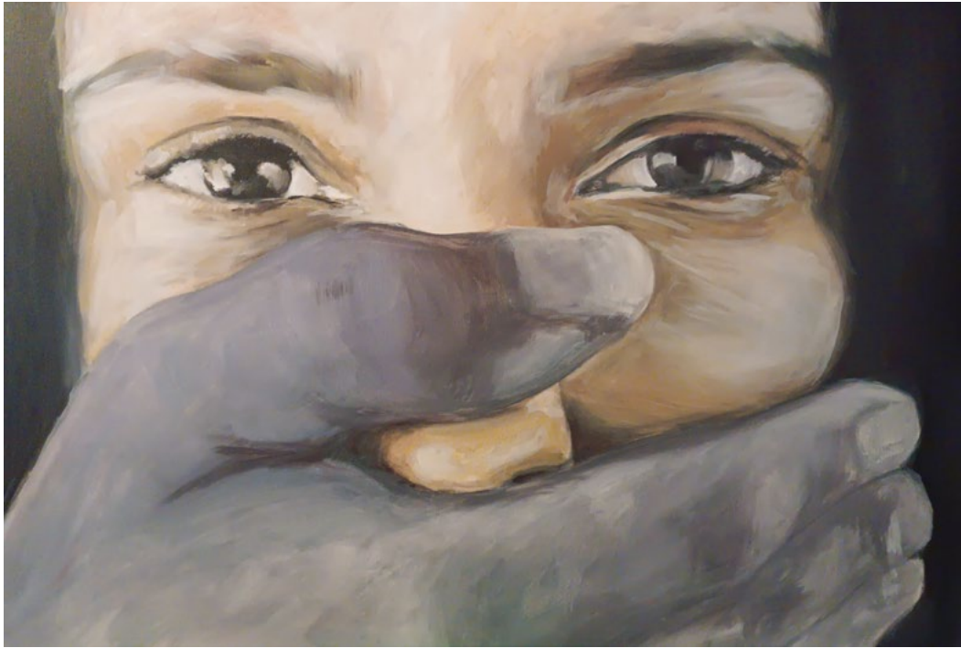
Libertad de expresión