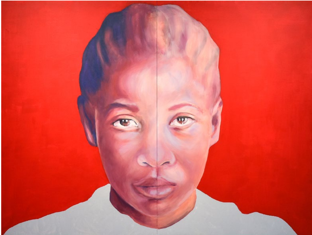
La gran esperanza