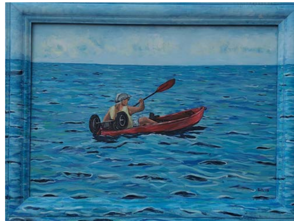
Papá con su kayak

En este cuadro he pintado elementos que me dan alegría, flores de colores, loros, mi ninfa Coco y mi periquito Blue, me encantan estas aves tan divertidas y cariñosas. Animalitos como el puerco espin y pájaros silvestres... Pintado con acrílico.