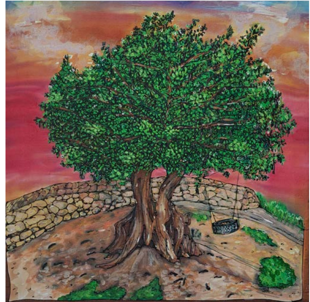
Atardecer en el algarrobo