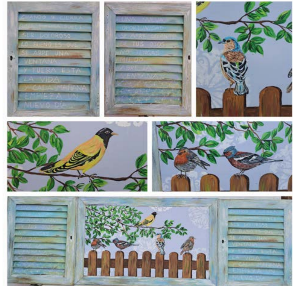
Abre tu ventana

Pinté este cuadro con unas ventanas antiguas que me encontré hace tiempo y por falta de tiempo y de inspiración las tenía aparcadas sin hacer nada con ellas. En el confinamiento tenía tiempo al tener que cerrar mi negocio y echaba de menos el mar, así que me pinté la playa para ¡disfrutar de las vistas!! La técnica es pintura acrílica y elementos encolados como arena, coral y red de pesca.