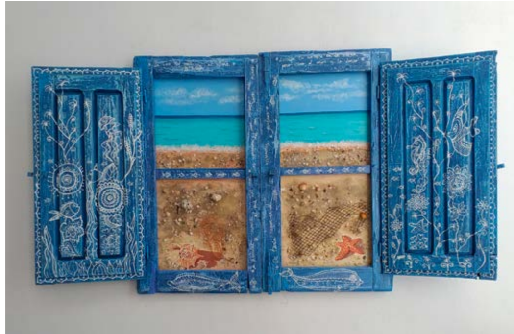
Ventana al Mar

Pinté este cuadro con unas ventanas antiguas que me encontré hace tiempo y por falta de tiempo y de inspiración las tenía aparcadas sin hacer nada con ellas. En el confinamiento tenía tiempo al tener que cerrar mi negocio y echaba de menos el mar, así que me pinté la playa para ¡disfrutar de las vistas!! La técnica es pintura acrílica y elementos encolados como arena, coral y red de pesca.