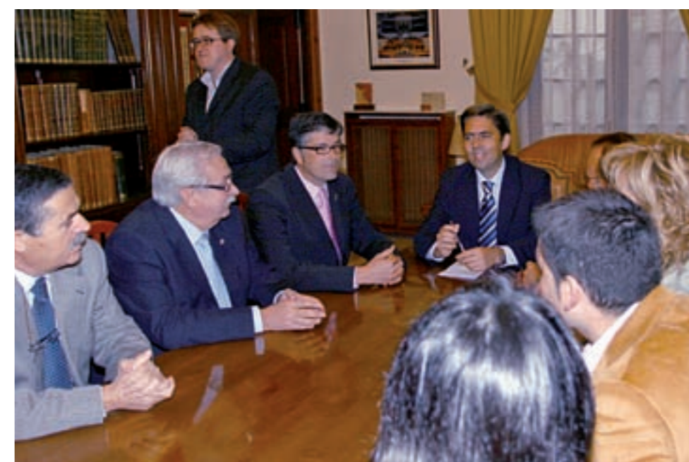
Vicent Rambla va anunciar que Benicarló comptarà amb un centre sanitari integrat

El vicepresident també es va comprometre a avançar en projectes com la depuradora, la carretera Benicarló-Càlig (que està en procés d'exposició pública), o la carretera Benicarló-Peníscola, que compta amb una dotació pressupostària de 6,4 milions d'euros en els comptes per a l'any que ve.