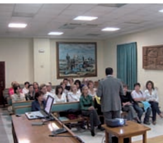
Una trentena de comerciants van participar en la jornada

La Regidoria de Comerç i Mercats va fer una valoració molt positiva i va remarcar que precisament el tracte personalitzat i diferenciat és un dels valors afegits del comerç tradicional.