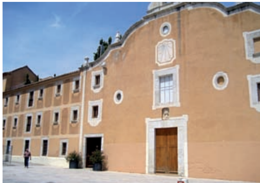
La declaració podria facilitar la restauració integral de la capella del Convent de Sant Francesc

Les Fassanes tradicionals de la zona hauran de mantenir el seu aspecte original i no es podran enderrocar, de manera que a més de protegir el patrimoni de la ciutat, aquesta declaració suposarà una recuperació de l'esplendor del casc antic de Benicarló. A més, l'Ajuntament s'ha mostrat favorable a fer extensiva aquesta protecció a la resta de la ciutat per tal que les Fassanes de les cases més em-