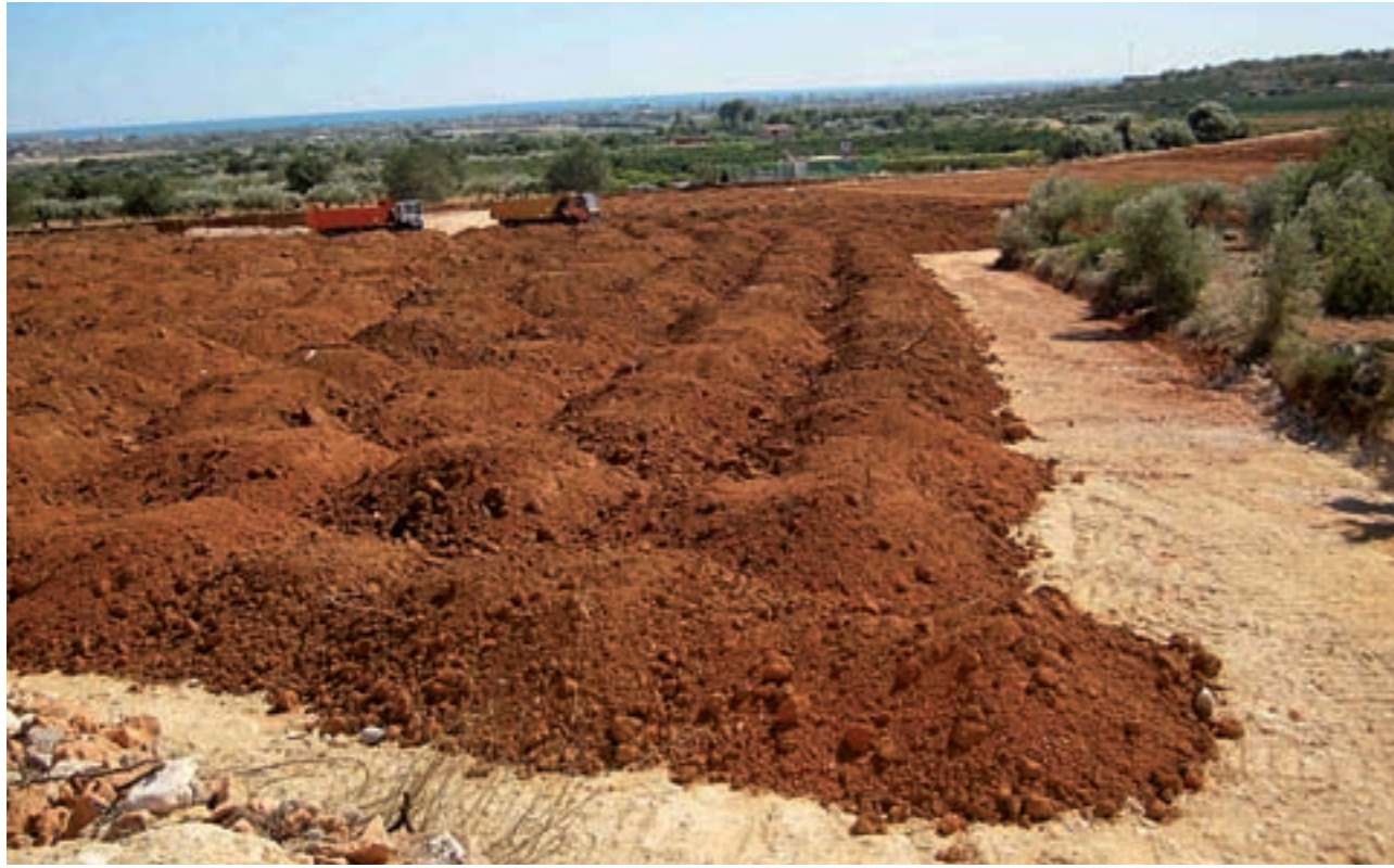
Imatge d'una de les transformacions no autoritzades

La Regidoria de Medi Ambient de l'Ajuntament de Benicarló ha iniciat expedients sancionadors i de regulació disciplinària contra tres actuacions no autoritzades de transformacions de finques amb moviments de terres amb variació del perfil dels terrenys situades a les