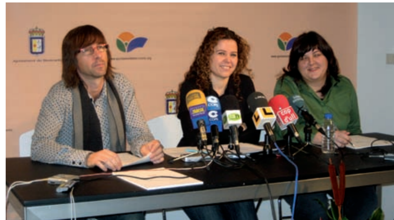
La regidora de Cultura va presentar la programació acompanyada dels tècnics de cultura de l'Ajuntament