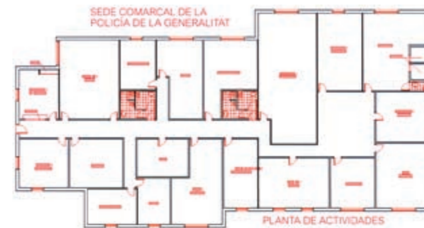
Model tipus del que seran les seus comarcals de la policia autonòmica