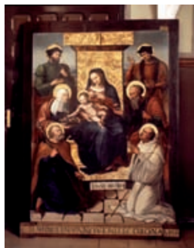
Retaule de la Mare de Déu del Remei, una de les peces més valuoses de l'església

una visita més personalitzada i participativa, cal que els interessats a assistir-hi concerten prèviament la visita a l'Oficina de Turisme, ubicada a la plaça de la Constitució. El rector de la Parròquia de Sant Bartomeu s'ha mostrat molt satisfet amb el resultat de les visites guiades, ja que era habitual que els visitants de Benicarló s'hi acostaren a l'església preguntant pels horaris de visita del monument.