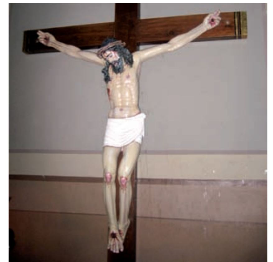
La imatge es troba actualment a la parròquia de Sant Bartomeu

Abans d'iniciar el procés de recuperació, els experts analitzaran l'estat actual de conservació del Crist a través d'un tac que se li practicarà a l'Hospital Provincial de Castelló.