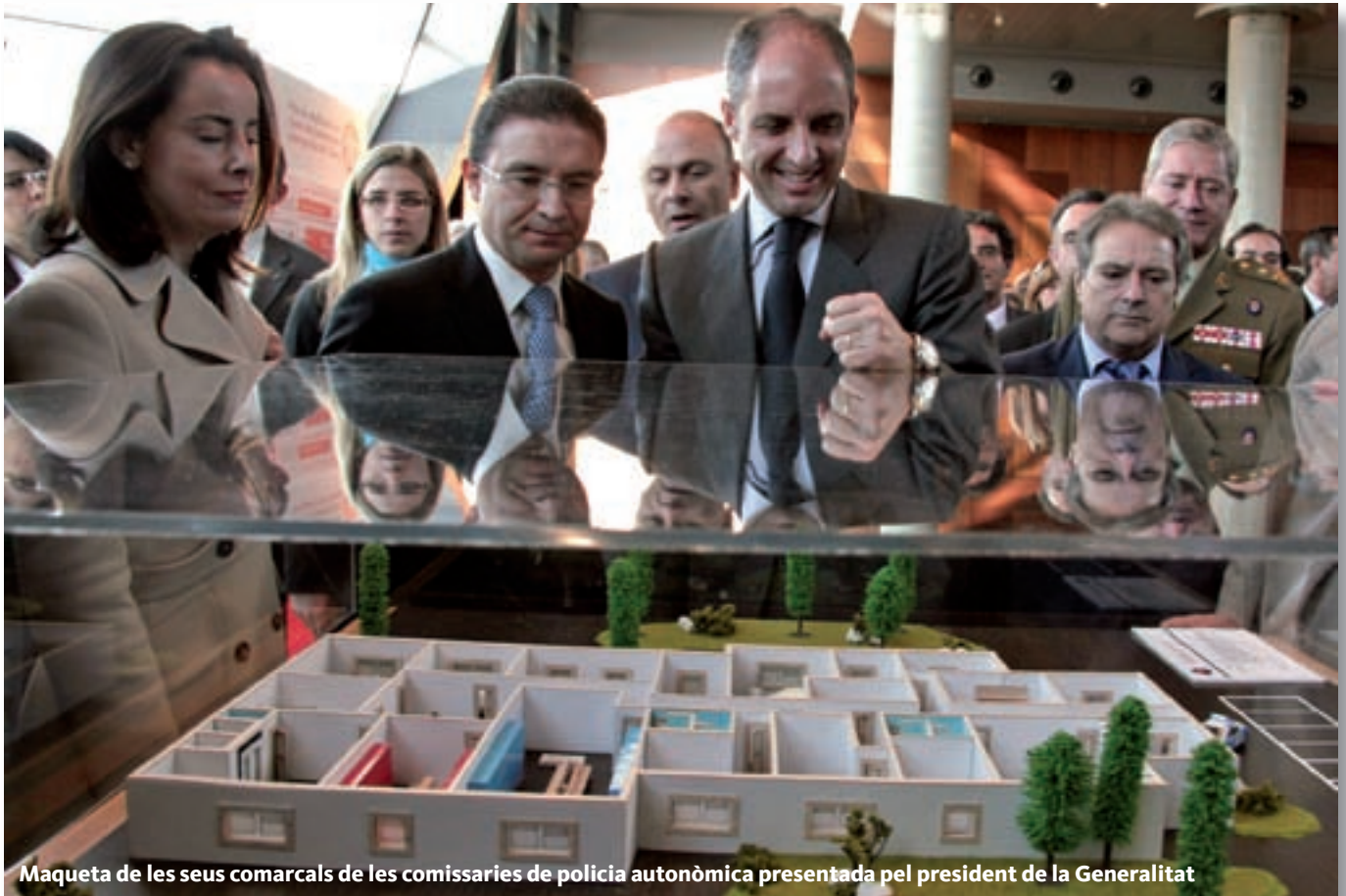
Maqueta de les seues comarcals de les comissaries de policia autonòmica presentada pel president de la Generalitat