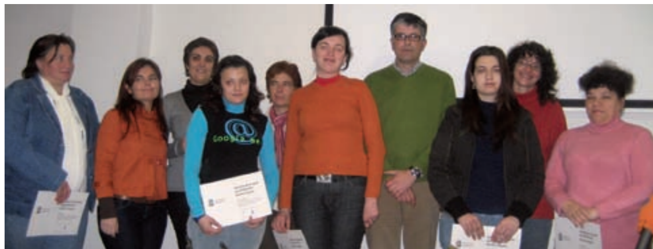
L'alcalde va lliurar un diploma a les dones que van participar en les primeres Jornades d'Acollida a nouvinguts

El passat 15 de gener es va presentar públicament la Guia d'Acollida i Recursos destinada a les persones nouvingudes. La guia ha estat coordinada des de l'oficina AMICS de Benicarló (Agència de Mediació, Integració i Convivència Social) i l'han elaborat els tècnics de l'oficina amb la col·laboració de mediadors i mediadores socials. El seu objectiu és convertir-se en un instrument útil per als nouvinguts que necessiten informació sobre temes sanitaris,