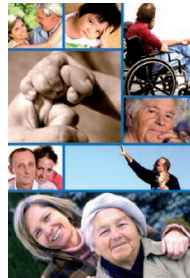
Imatges del catàleg que la conselleria de Benestar Social ha editat per informar sobre la Llei de Dependència

Per als qui puguem estar interessats en alguna qüestió sobre la llei, Serveis Socials informa que el reconeixement de la situació de dependència s'inicia a instància de la persona interessada, presentant la sol·licitud, junt amb la documentació requerida, a l'oficina PROP de Vinaròs (c. de Sant Joaquim). Les sol·licituds es poden trobar al Centre Social La Farola o també es poden descarregar directament des de la web www.todoloquenecesites.org .