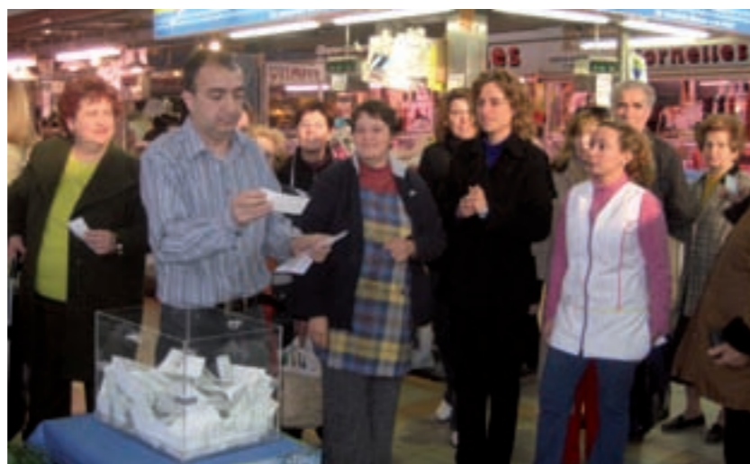
El primer sorteig es va fer el passat 30 de gener al Mercat Central

L'edició 2008 de les Jornades Gastronòmiques de la Carxofa es complementaran, per tercer any consecutiu, amb la campanya que, amb el lema "T'invitem!", sortejarà entre els clients del Mercat Central 80 menús-degustació per a provar gratuïtament, de dilluns a divendres, els plats dels 12 restaurants de Benicarló i comarca que participen. La campanya permetrà premiar la fidelitat dels clients dels comerços amb el sorteig diari, durant 8 dies (entre el 30 de gener i el 8 de febrer, excepte el cap de setmana), de 5 invitacions dobles i al mateix temps augmentarà la difusió de les Jornades de la Carxofa. Aquesta campanya, que ja en anteriors edicions va tenir una molt bona acollida entre comerciants i cli-