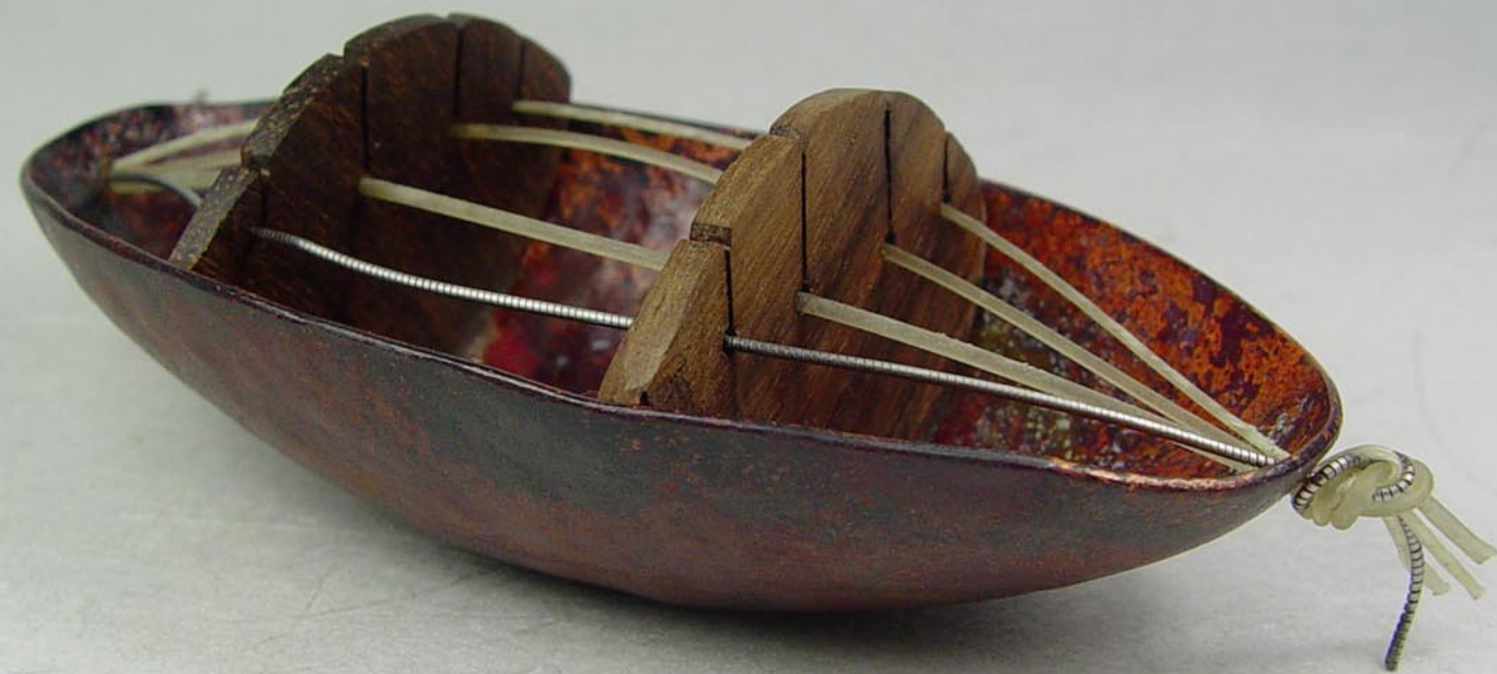
Orfeo Objete Coure cisellat i patinat, banús i cordes de violí