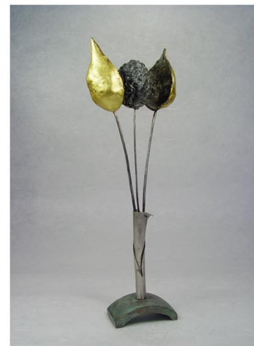
Per tu no passa el temps Objete Bronze, plata i pà d'or