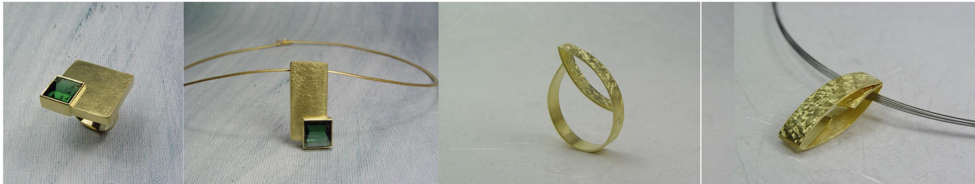
Col·lecció Mur Anell i penjoll Or groc de 18K i Turmalina verda talla Mirall