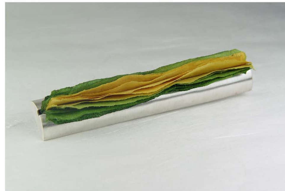
Col·lecció Interiors Fermall Plata i paper japonès pigmentat