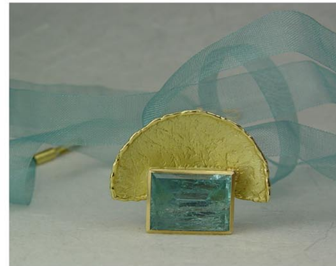
Sevilla Penjoll Or groc de 18K i Aiguamarina