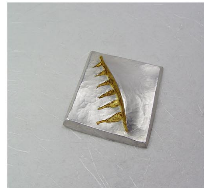
Col·lecció Havana Fermall-Penjoll Plata cisellada i Urushi