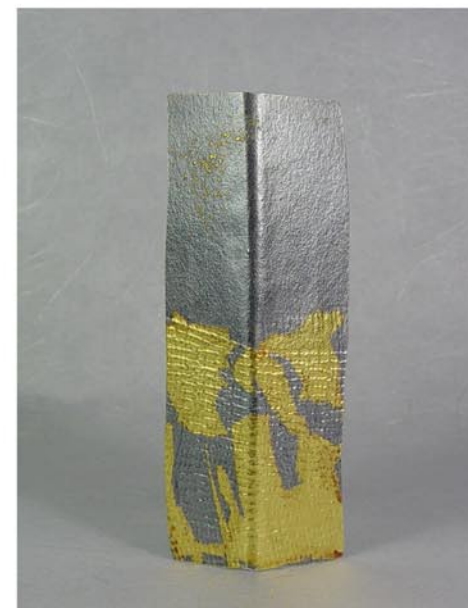
Col·lecció Cingle Fermall Plata i or de 24K Tècnica Kum-boo