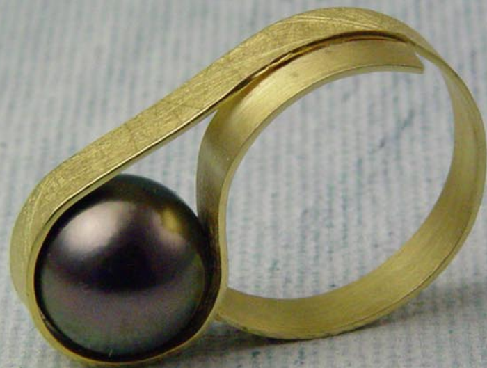
Col·lecció Plec rodó Anells Or groc de 18K