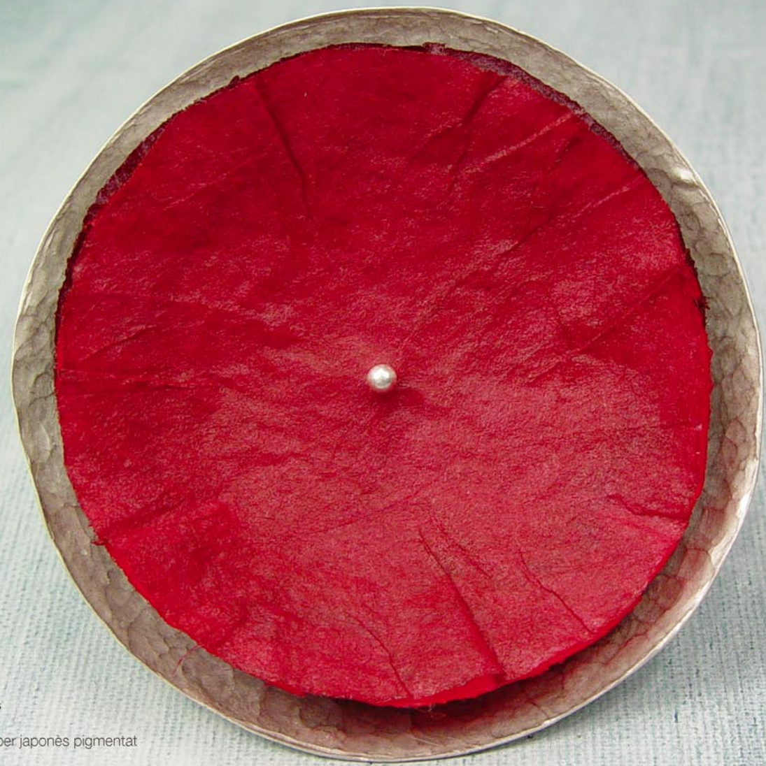
Col·lecció Interiors Fermall rodó Plata cisellada i paper japonès pigmentat