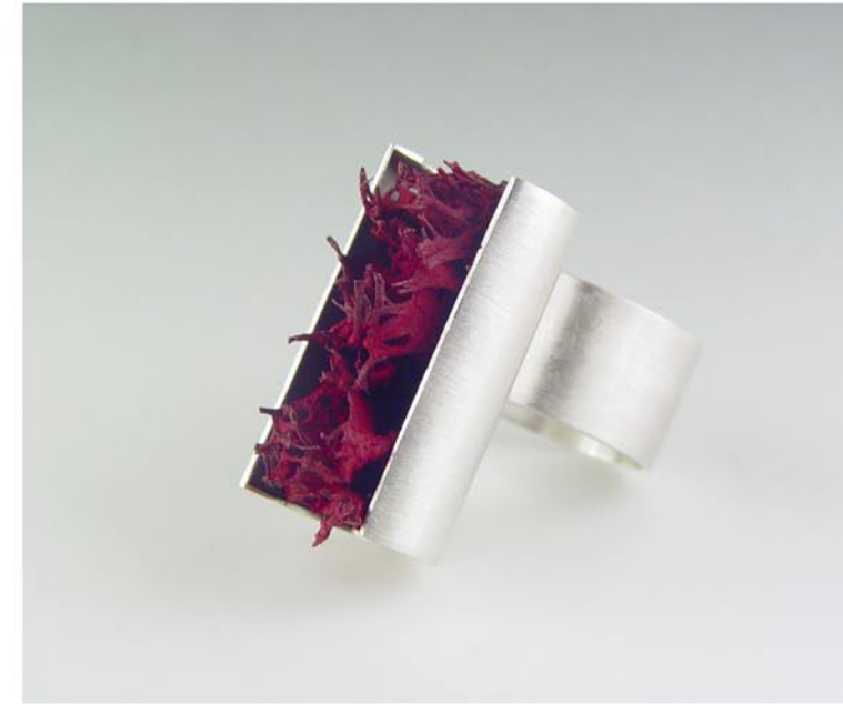
Col·lecció Interiors Fermall i anell fibra. Plata i fibra vegetal pigmentada. Fet a mà