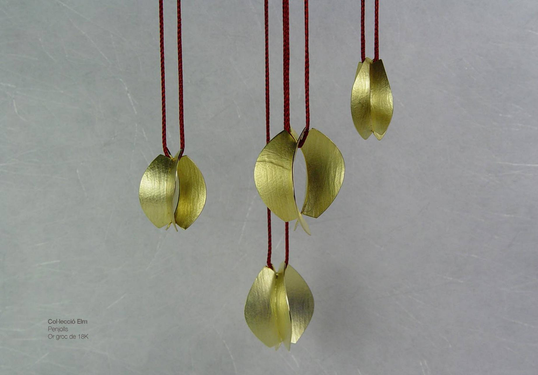
Col·lecció Elm Penjolls Or groc de 18K