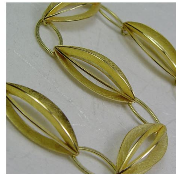
Col·lecció Rosa Arracades i polsera Or groc de 18K