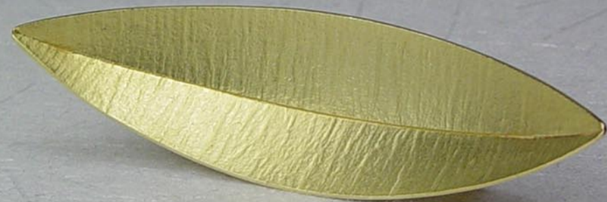
Col·lecció Beina Fermall Or groc de 18K