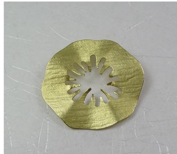
Col·lecció Cèl·lula Fermall Or groc de 18K