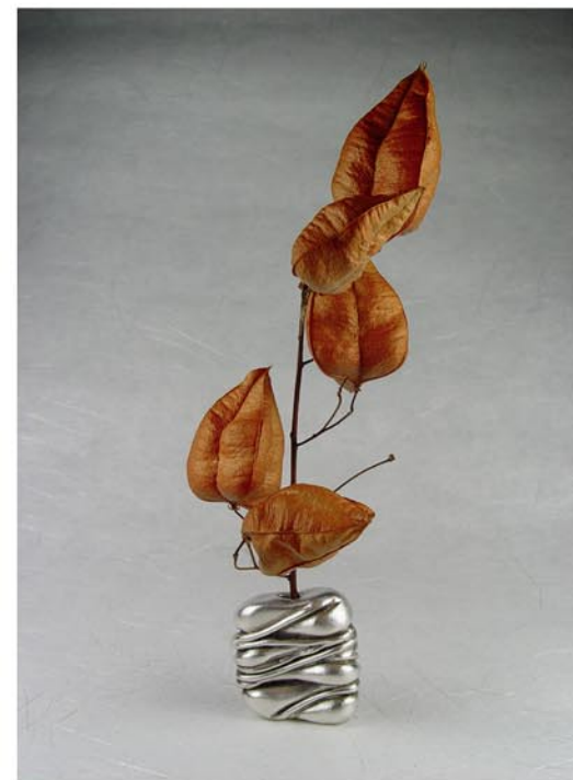
Noguchi Objete Plata