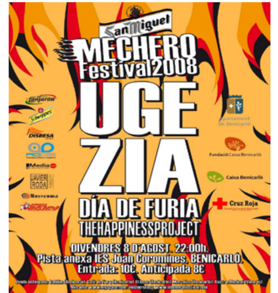
El Mechero Festival torna a Benicarló amb força