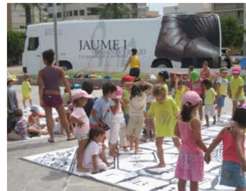
Nombrosos xiquets han participat en les activitats de l'Autobús Jaume I

en didàctica per explicar als xiquets i adults la importància que va tindre la figura històrica de Jaume I. Entre les activitats que