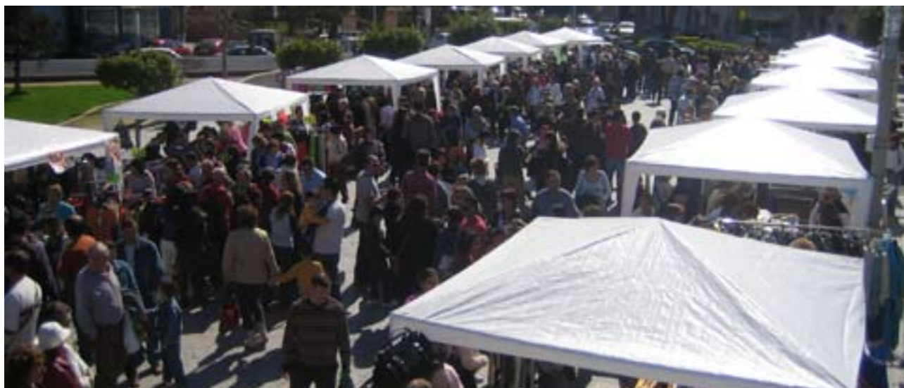
Nombroses persones van assistir a l'edició de febrer de "Comerç al carrer"

Roba de dona, home, xiquet, moda esportiva, sabates, roba per la casa, bosses, complements, perfums, plantes, bijuteria, fotografia, regals, joguets... de tot i més, podràs trobar al tradicional "Comerç al carrer".