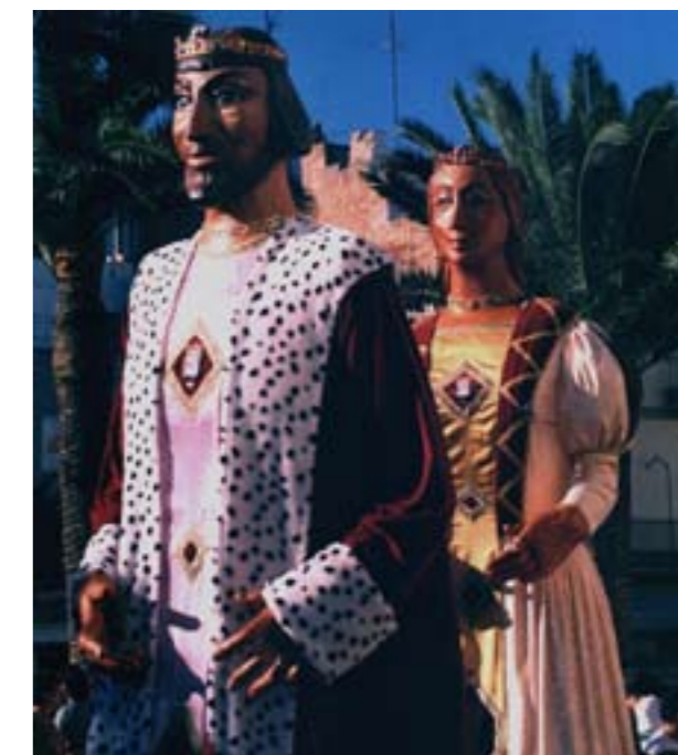
Gegants i cabuts passejaren pels carrers del poble durant la setmana de Festes

activitats de les penyes, la fira alternativa, el mercat d'època, les mascletades i els correfocs, el sopar de pa i porta... Un complet programa, que podeu consultar a la secció "Festes" de www.ajuntamentdebenicarloro.org .