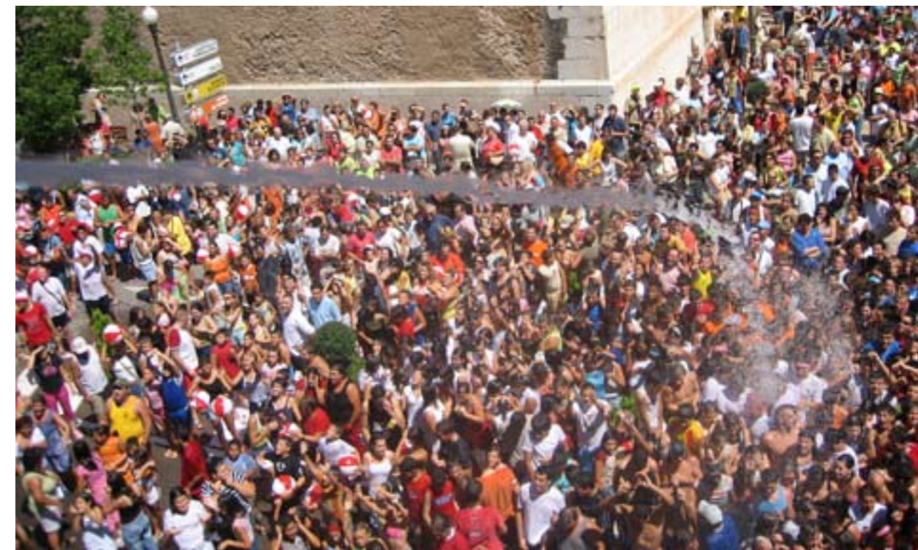
La Crida marcarà l'inici de les Festes el dia 16 d'agost

La setmana del 16 al 24 d'agost acollirà les Festes en honor als patrons Sant Bartomeu, els Sants Màrtirs Abdó i Senén i Santa Maria del Mar. Per això, la Comissió de Festes, amb l'ajut de les entitats i les penyes, han preparat una variada programació amb més de 200 actes i activitats per gaudir-les amb intensitat.