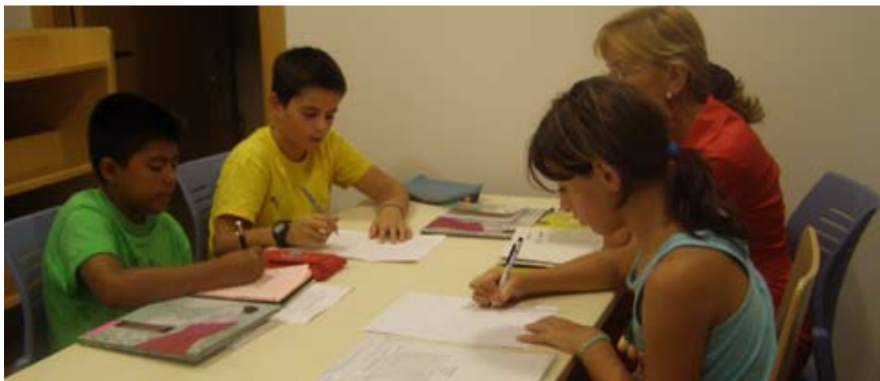
El Club de Lectura Juvenil es tornarà a reunir el 4 d'agost

Les vesprades dels mesos d'estiu, la Biblioteca Municipal és un lloc de referència per als menuts, gràcies als tallers didàctics que s'ha organitzat. Així doncs, activitats com ara els contacontes participatius aconseguixen que els xiquets es divertis-