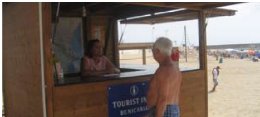
Una mitjana de 49 persones s'apropen al punt d'informació turística diàriament

L'objectiu principal d'aquesta iniciativa és apropar els serveis d'informació i acollida al turista que visita les platges de Benicarló, un dels punts que concentra major afluència de públic. De fet, des de la seua posada en marxa i fins el dia 30 de juny, el punt d'informació ha atès un total de 638 persones, el que representa una