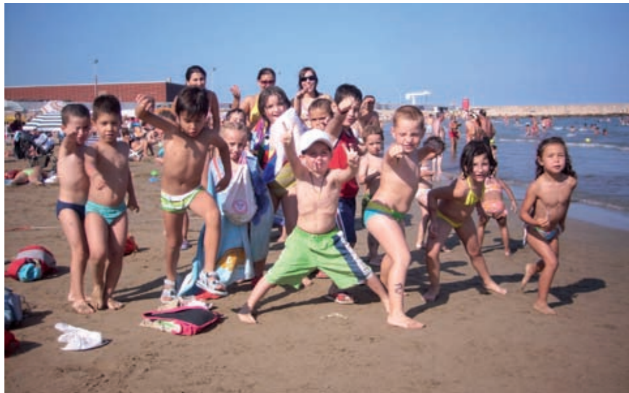
Els xiquets de l'Escola d'Estiu en una de les sortides a la platja

La Regidoria de Serveis Socials dedica el mes d'agost a la família. Conscients que el concepte de família ha evolucionat i ha donat pas a un nou model que recull de forma més clara la diversitat familiar existent, les polítiques familiars adquireixen un protagonisme creixent en l'agenda de les administracions.