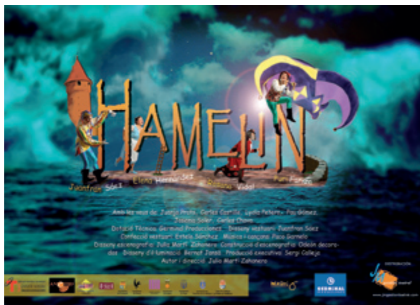
Magic 6 ha encisat el públic benicarlando, en anteriors temporades, amb 'I tu què vols ser de major' i 'Uuuuh!'

Així doncs, l'1 de març la companyia Magic 6 portarà a escena l'espectacle musical Hamelin . D'altra banda, el dimarts 24 de març, s'estrenarà a l'Auditori Els sons de la terra , concerts pedagògics de músiques ètniques patrocinats per l'Obra Social Caja Madrid que cerquen l'aproximació a valors com la tolerància, l'amistat i la solidaritat implícits en la música.