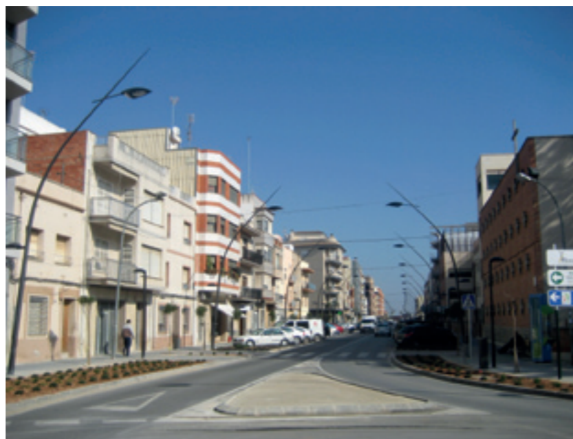
El nou enllumenat de l'avinguda està previst que comence a funcionar a primers de mes

Les obres es van adjudicar per import de 506.344,64 euros i han estat subvencionades per la Conselleria de Presidència de la Generalitat Valenciana, amb 520.000 euros, i per la Conselleria d'Indústria, Comerç i Innovació de la Generalitat Valenciana, amb 250.000 euros.