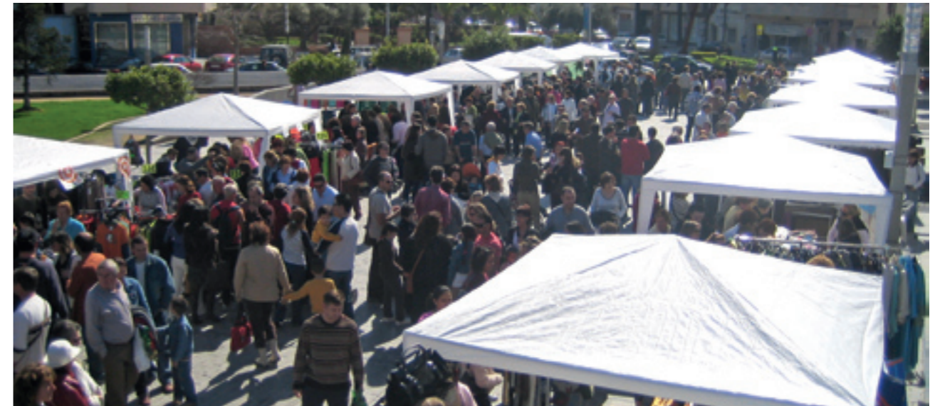
Nombrosos clients aprofiten 'Comerç al carrer' per realitzar les últimes compres de la temporada

L'última edició de la campanya Comerç al carrer , prevista per al passat 28 de febrer, va haver de suspendre's a causa de la pluja. Així doncs, Comerç al carrer tindrà lloc el dia 14 de març a la pl. de la Constitució.