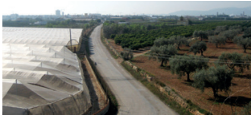
El projecte preveu millorar l'asfaltat del camí de Benicarló-Ulldecona

El camí de les Alcores està situat al nord-oest del terme i la inter-