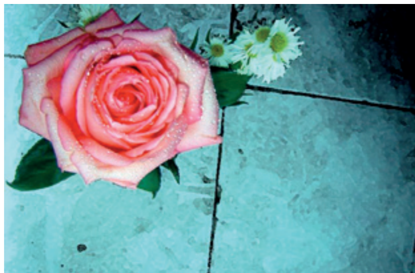
El Calendari Social vol que l'esperit del Dia Internacional de la Dona pervisca tots els dies de l'any

Concretament, els Serveis Socials Municipals ofereixen atenció personalitzada al col·lectiu, a través de l'assessorament jurídic o d'activitats més específiques com ara el taller d'acollida a dones immigrants. Especial atenció mereix també el programa específic d'atenció a les dones víctimes de la violència de gènere que es porta a terme al municipi a través dels Serveis Socials, Policia Local i Guàrdia Civil. A més, Benicarló compta amb una forta