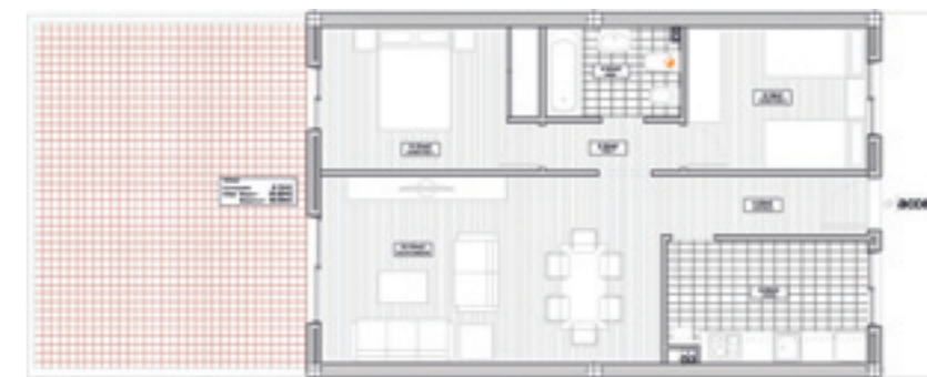
Plànol de distribució d'un dels habitatges

L'Ajuntament de Benicarló ha iniciat el procediment de selecció de les persones adjudicatàries de 36 habitatges de protecció oficial que es construiran en les parcel·les de propietat municipal situades a la zona de Sant Gregori. Amb aquesta iniciativa la corporació pretén facilitar l'accés a l'habitatge a tots aquells ciutadans que complisquen una sèrie de condicions, com ara haver nascut després de l'1 de gener de 1973 o estar empadronat a Benicarló des de fa 10 anys.