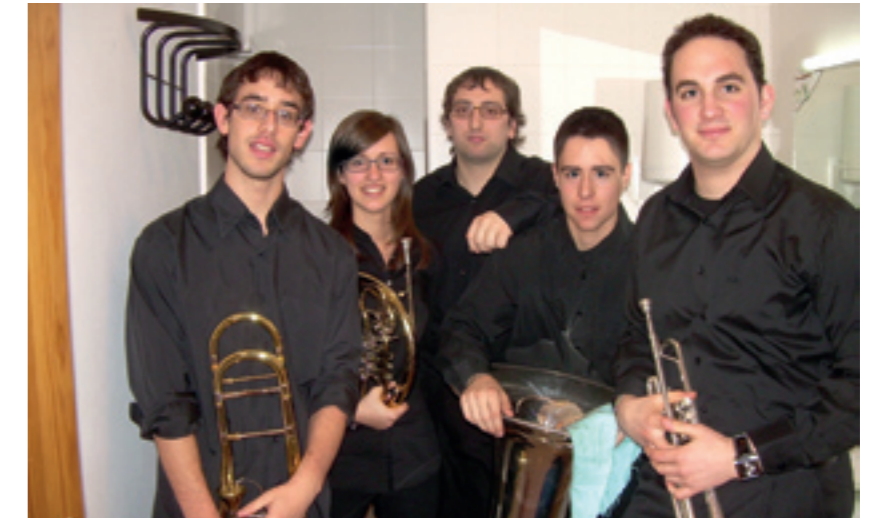
Els alumnes integrants del Conservatori de Benicarló Brass Quintet

El quintet de vent-metall, Conservatori de Benicarló Brass Quintet, va aconseguir el segon premi del XV Concurs de Música de Cambra José Peris Lacasa, que va tindre lloc el passat 14 de febrer a la ciutat d'Alcanyís.